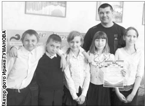
↑ Проект «Чтобы помнили» учащиеся средней школы №4 защитили с честью

В образовательных учреждениях Карабаша в последние годы заметно оживилась проектная деятельность.