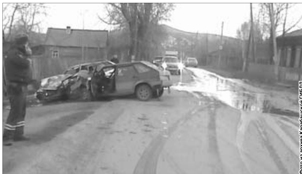
Сотрудники ДПС прибыли на место происшествия, когда пострадавшие уже были госпитализированы в городскую больницу

Впрочем, найти «беглеца» полицейским не составило труда. Виновник ДТП оказался жителем Миасса, но проживал в Карабаше. Когда произошло его задержание, он находился