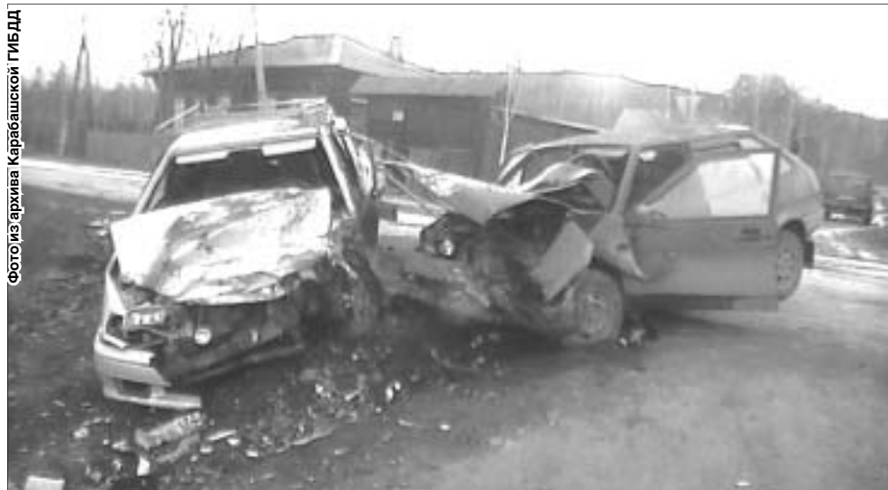
Выехавший на главную дорогу водитель «девятки» не справился с управлением и совершил лобовое столкновение с ВАЗ-2114

в состоянии алкогольного опьянения. Снимал стресс после пережитого, пояснил владелец «девятки». Тем не менее, очевидцы произошедшего утверждают, что водитель был пьян уже в момент совершения ДТП и не справился с управлением. По неподтвержденной информации вместе с ним в салоне автомобиля находились и другие пассажиры, которые успели скрыться во время заварухи.