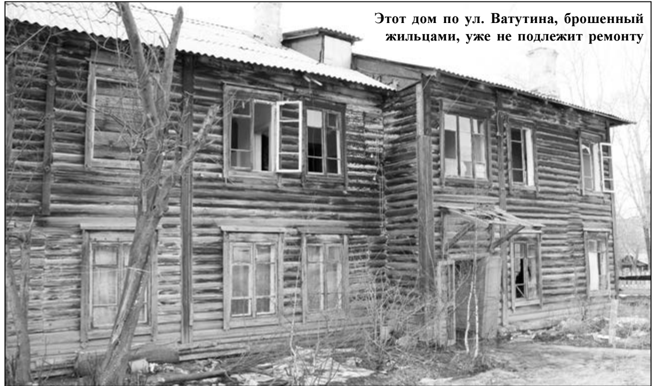
Этот дом по ул. Ватутина, брошенный жильцами, уже не подлежит ремонту

В администрации городского округа взялись за недобросовестных нанимателей муниципального жилья