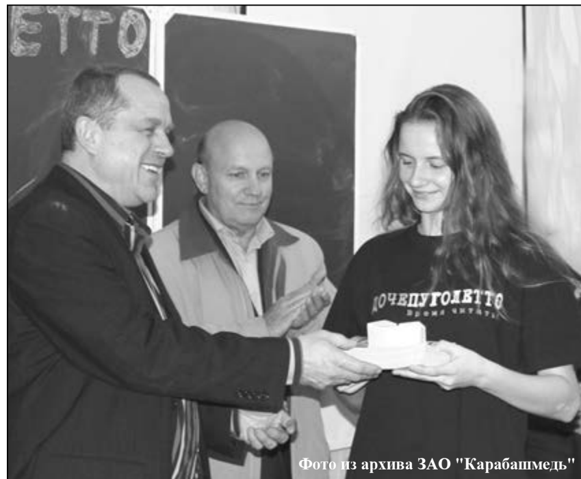
Фотопортрет из архива ЗАО "Карабашмедь"