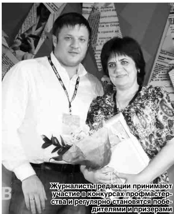
Журналисты редакции принимают участие в конкурсах профмастерства и регулярно становятся победителями и призерами