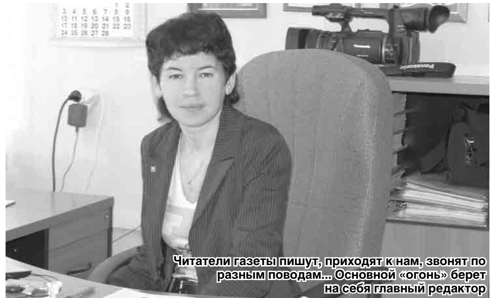
Читатели газеты пишут, приходят к нам, звонят по разным поводам... Основной «огонь» берет на себя главный редактор

Сейчас уже в силу возраста я стала плохо видеть, но это не мешает мне оставаться в курсе событий, потому что любимую газету мне читает муж. Где, что и как происходит в городе – мы узнаем из «Карабашского рабочего». Пусть городская газета развивается и дальше, а всем сотрудникам редакции желаю здоровья и успехов в вашем нелегком деле!