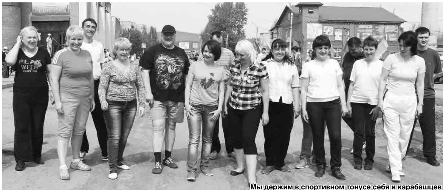
Мы держим в спортивном тоне себя и карабашцев