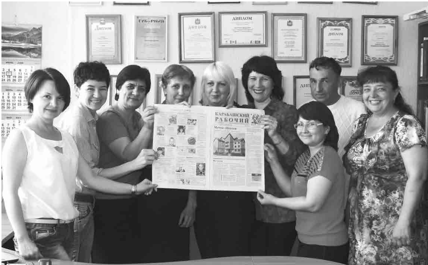
Коллектив «Карабашского рабочего» молод и полон планов