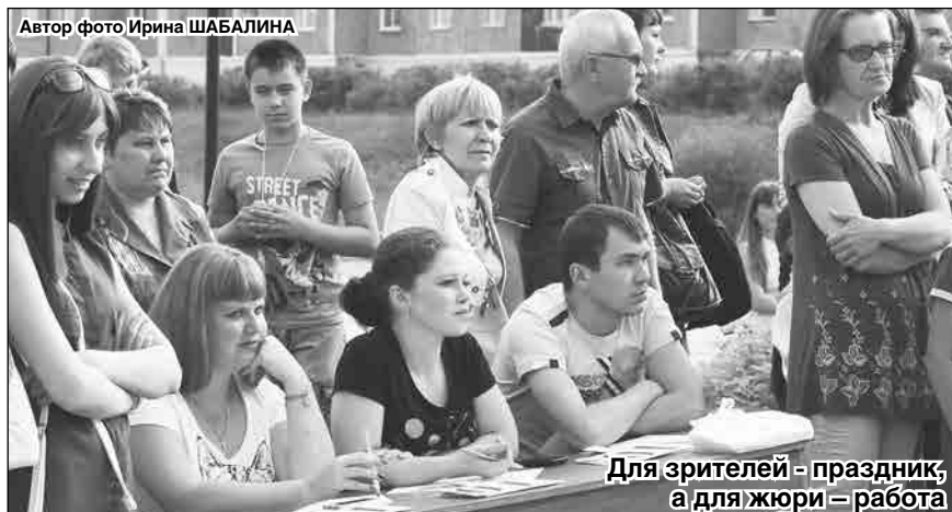
Для зрителей – праздник, а для жюри – работа