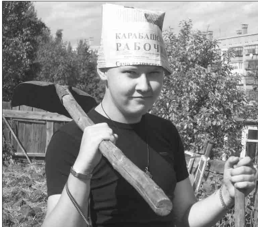
↑ «Мир, труд, май, газета», автор Антон Мерзликин

Наши читатели подошли к конкурсу достаточно творчески, а в ряде случаев – креативно. На конкурс было прислано большое количество работ, из которых мы выбирали самую лучшую.