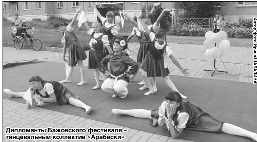
Дипломанты Бажовского фестиваля – танцевальный коллектив «Арабески»

Вторая половина праздника прошла под девизом: «Найди 10 отличий». День защиты детей, День России, а вслед за ними и День молодежи оказались похожи друг на друга, как близнецы – те же коллективы, исполнители, концертные номера, оформление. Конкурсную программу «Минуты славы» разнообразили лишь выступление гиревиков, ловко жонглировавших гириями, девушки из коллектива «Арабески» с новыми но-