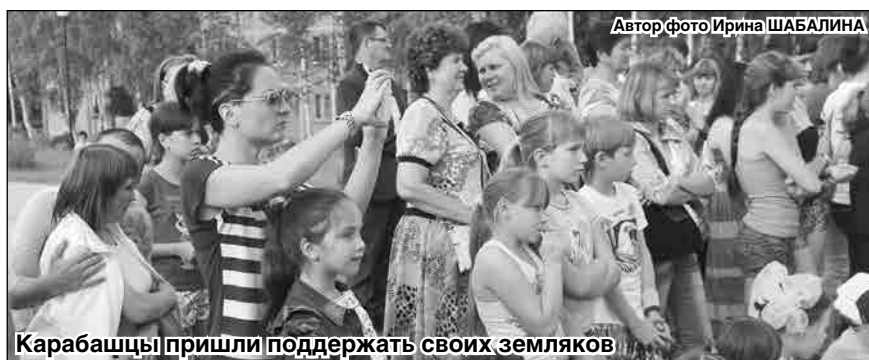
Карабашцы пришли поддержать своих земляков