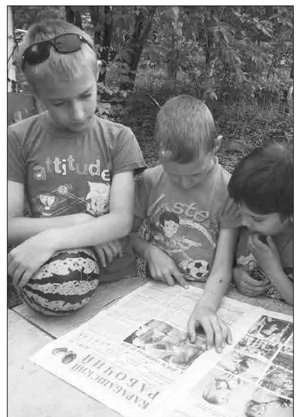
↑ «Ну, очень интересная газета! Футбол подождет», автор Лариса Мерзликина