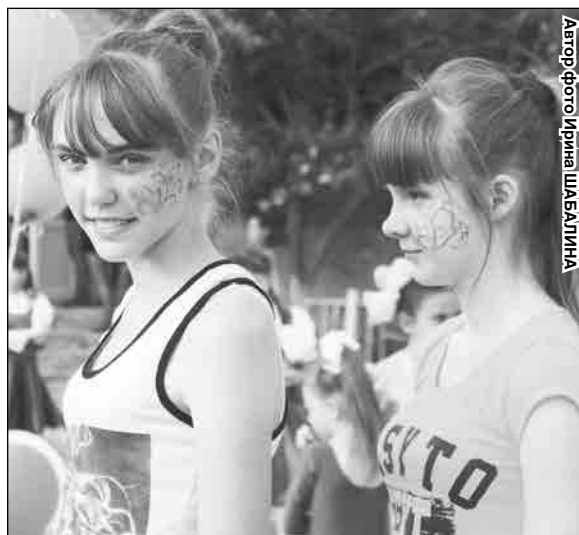
↑ Участницы танцевального коллектива «Фантазия» перед выходом на сцену