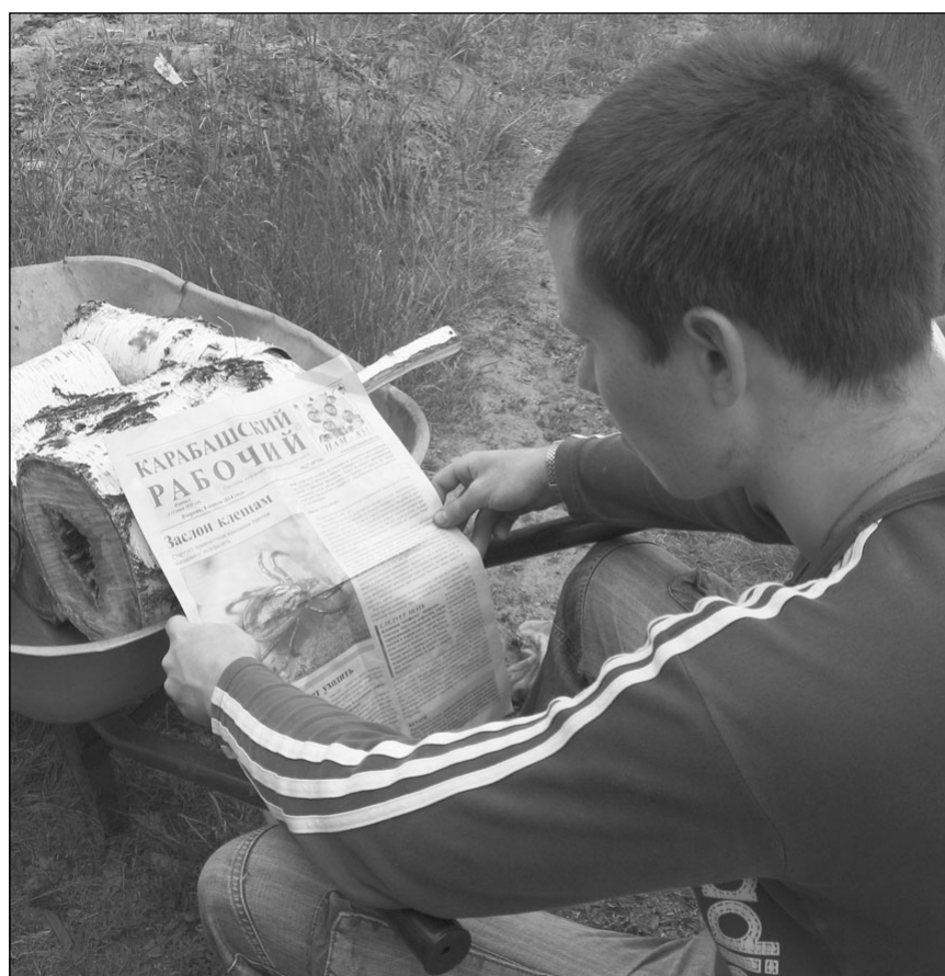
↑ «Актуальная тема – заслон клещам», автор Людмила Бахарева