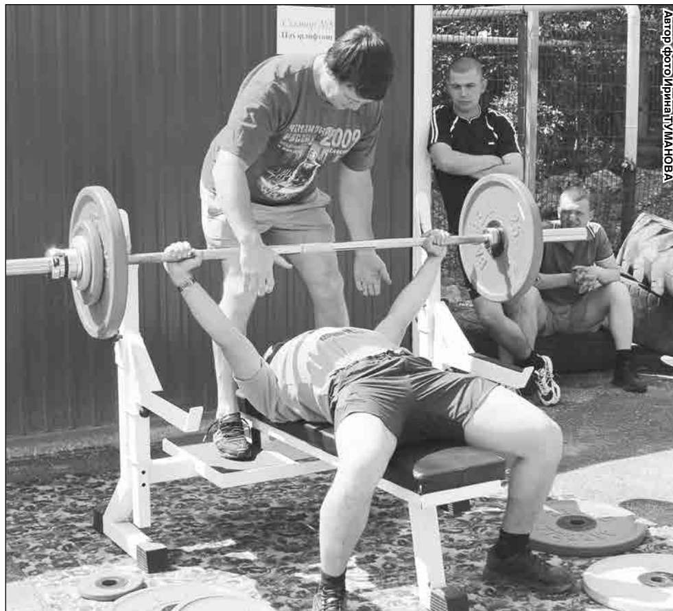
↑ Выполнить жим штанги лёжа - задача сложная, но выполнимая