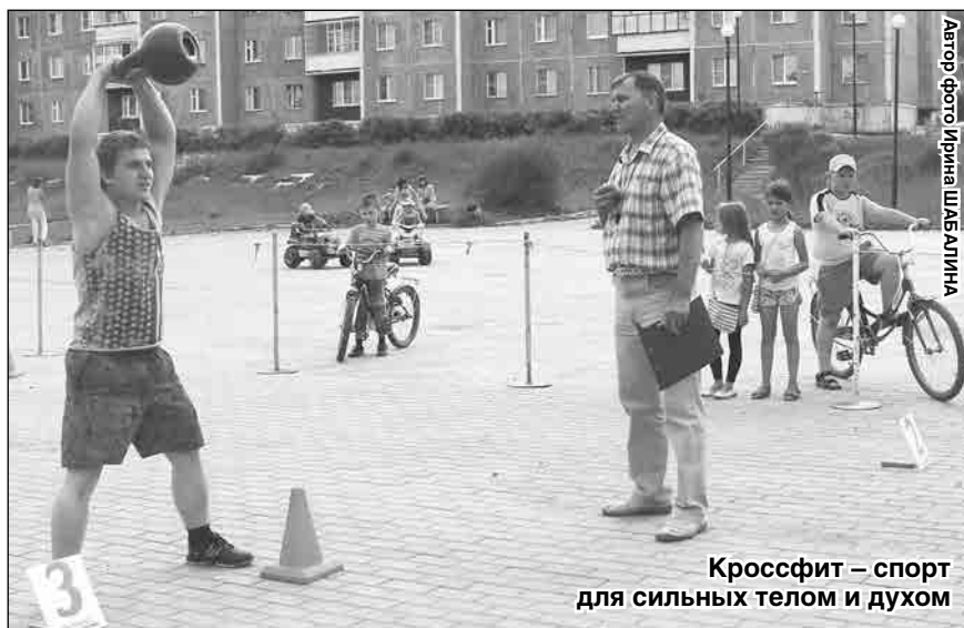
Кроссфит – спорт для сильных телом и духом

Словом, создалось впечатление, что у работников культуры Карабаша иссякли идеи и творческий потенциал.