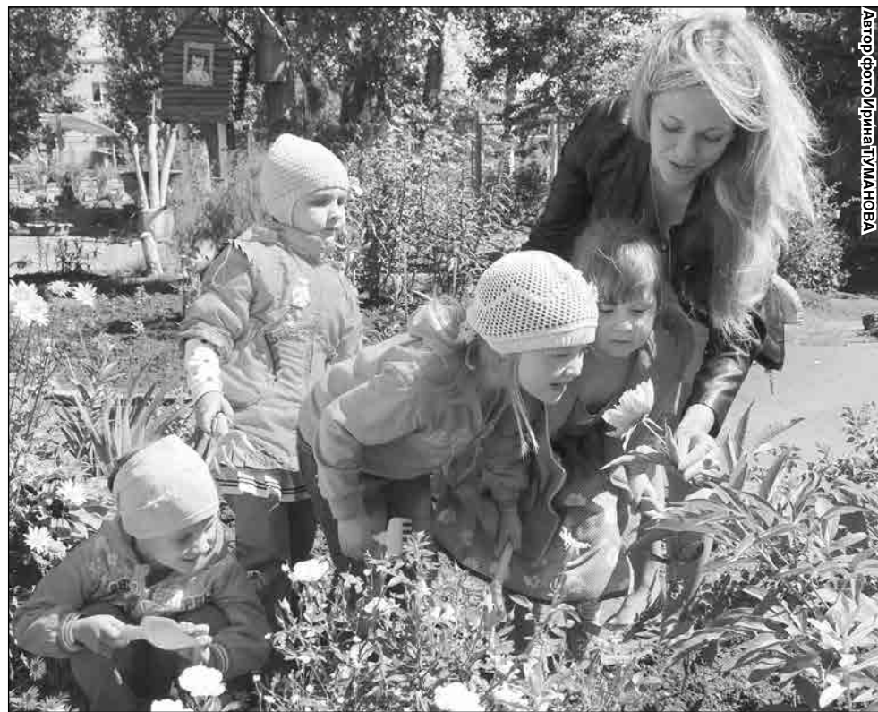
↑ Дети не только наблюдают за цветами, но и с удовольствием ухаживают за ними