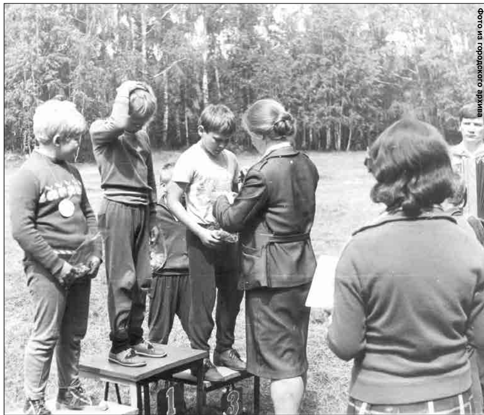
из олово. викаре оловофотой