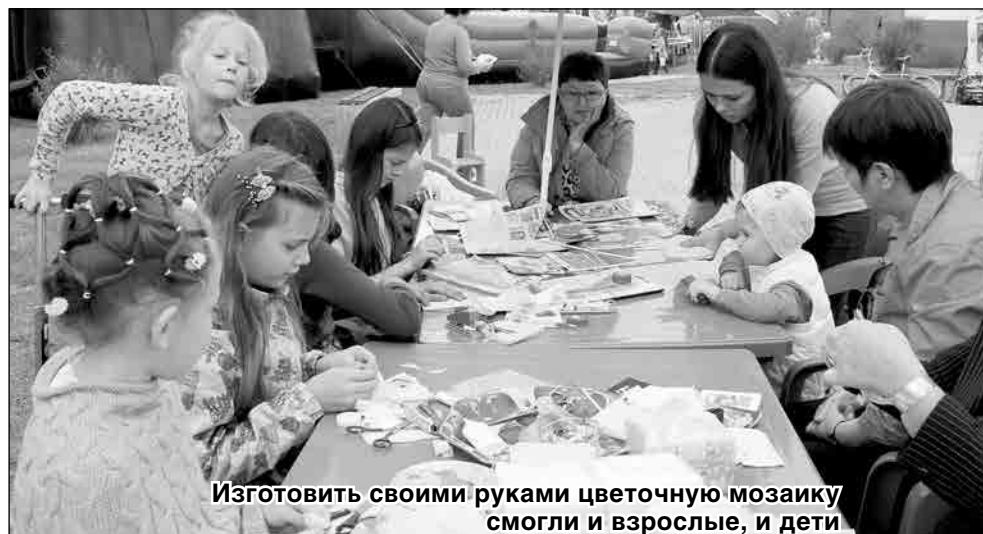
Изготовить своими руками цветочную мозаику смогли и взрослые, и дети

Надо отдать должное и зрителям - большинство осталось на Аллее ветеранов, несмотря на ненастье. Они были вознаграждены за свое терпение фантастическим файер-шоу и праздничным фейерверком.