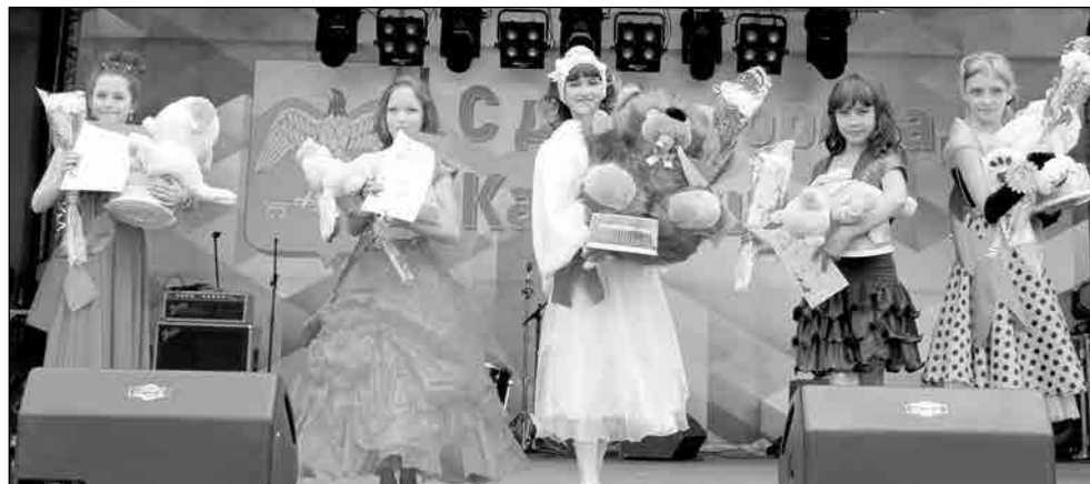
↑ Каждая из участниц конкурса «Маленькая Мисс-2014» получила свой титул

отмечали главные городские праздники новыми рекордами на соревнованиях, организованных отделом спорта и туризма и спортклубом. На хоккейном корте шли футбольные матчи, на специально подготовленной площадке – турнир по пляжному волейболу. Параллельно состоялись гиревика и пауэрлифтеры, семейные команды выступали в эстафете, сражение за лидерство кипело на теннисных столах и шахматных досках.