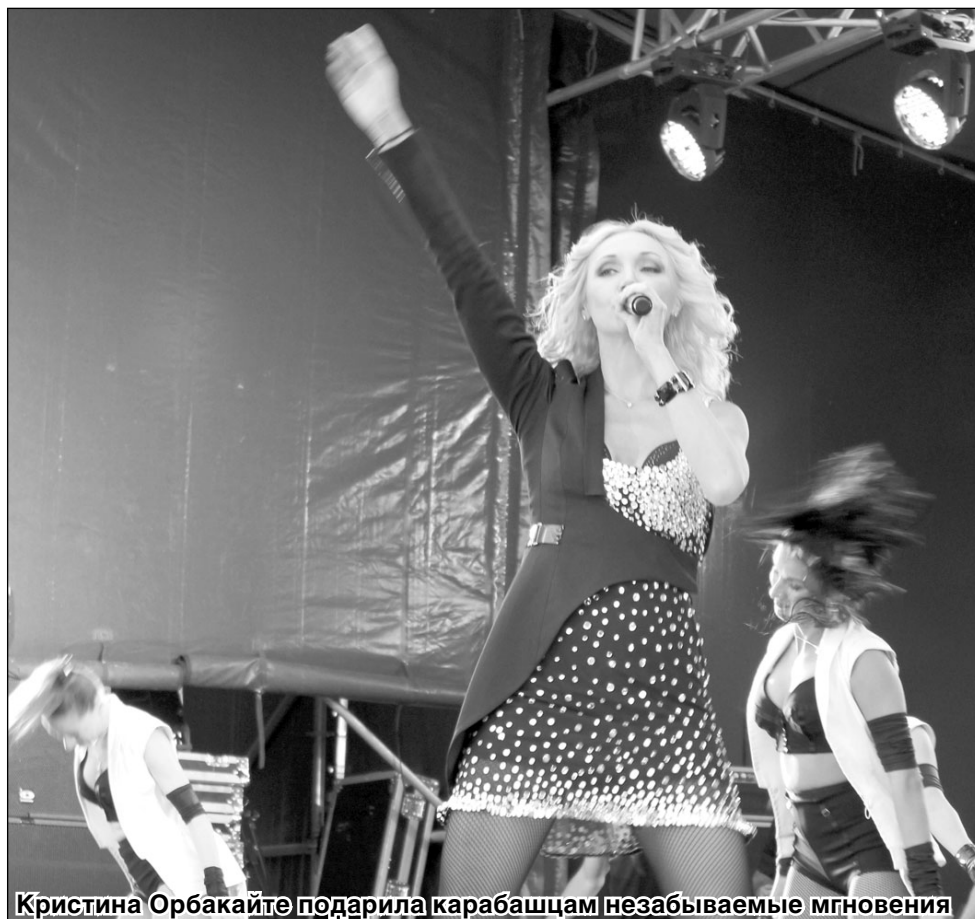
Кристина Орбакайте подарила карабашцам незабываемые мгновения