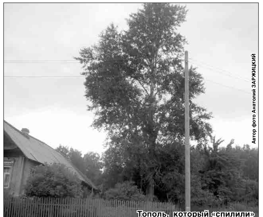
Тополь, который «спилили»

Стоит отметить, что в активе учащихся четвертой школы немало других «Добрых дел». Юные экологи регулярно принимают участие в субботниках на озере Увильды, подкармливают птиц, занимаются сбором вторсырья на окрестных озерах, чистят территорию, прилегающую к памятнику 96 карабашским борцам, и собирают макулатуру, чтобы на заработанные деньги купить школьные учебники.