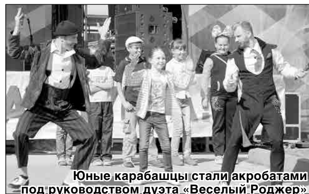
Юные карабашцы стали акробатами под руководством дуэта «Веселый Роджер»

жер», завершившая дневную программу праздника. После короткого перерыва горожане принимали поздравления от главы городского округа Вячеслава Ягодинца, председателя Собрания депутатов Дмитрия Шуткина, министра юстиции Челябинской области Валерия Быкова, вице-президента ЗАО «Русская медная компания» Олега Грачёва, помощника